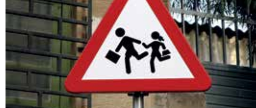
Veilig naar school? Uw mening telt! p. 3