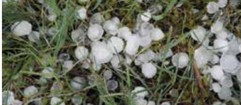
Kortemark erkend als rampgebied na storm p. 2